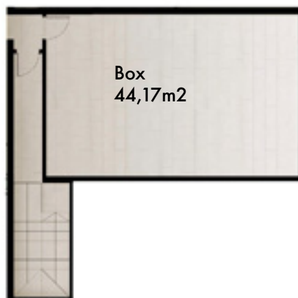
Planta Depto 101 nivel -1

PARQUE COUSIÑO MACUL · EN LA CIUDAD, OTRA VIDA ·